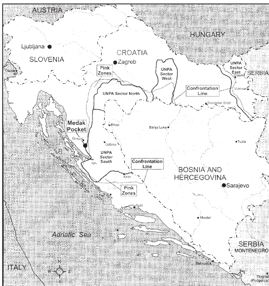
Slika 17: Područja zaštićena snagama Ujedinjenih naroda i Medački džep