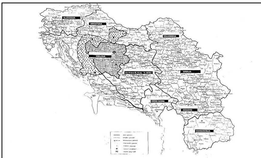
Zamišljena "federalna jedinica Krajina" ("SAO Krajina" i "Bosanska Krajina"), kao zapadni dio nove Jugoslavije (Ekonomski institut, Banja Luka, 1991., M. Begić 2015: 32)

pod srpskom kontrolom, a jamačno su dobro uočili i 'povoljno' međunarodno ozračje, uključujući mirenje međunarodne zajednice s uništavanjem Vukovara i s pokoljem vukovarskih civila, kao i činjenicu da je UN brzo i bez ikakvih pitanja prihvatio mirovni plan za Hrvatsku, izrađen u Beogradu. Nespremnost međunarodne zajednice da u Bosnu i Hercegovinu pošalje barem preventivne snage i njezino istodobno inzistiranje na općem i sveobuhvatnom embargu na oružje još je više uvjerilo Srbe u Beogradu i one na Palama da svoje ciljeve u Bosni i Hercegovini mogu postići prilično nekažnjeno". 20