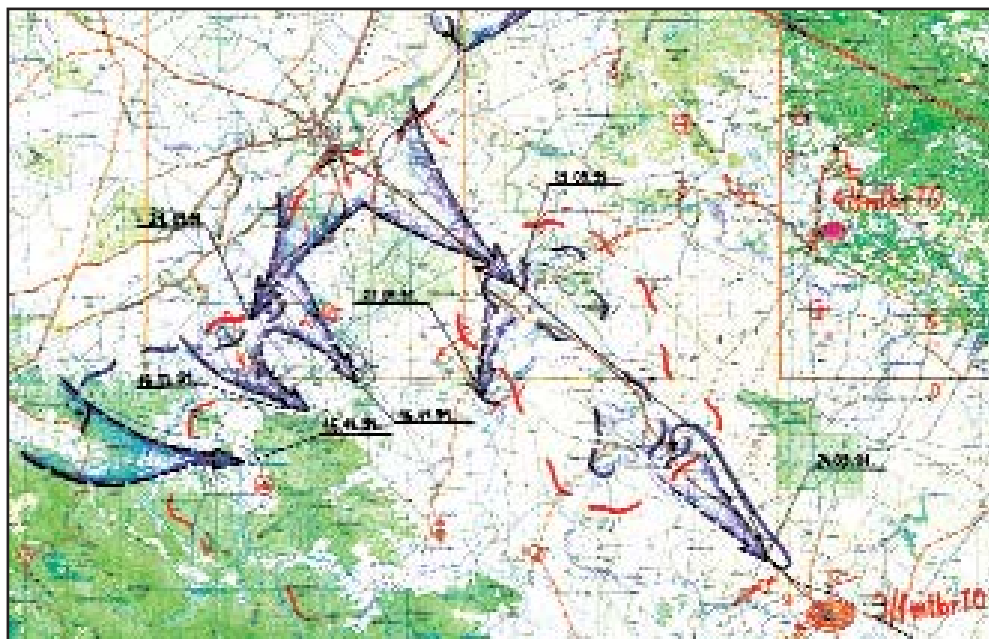
Slika 12: Gospić 10-11.1991. - zamisao hrvatske vojno-redarstvene operacije, jesen 1991.

Neprijatelj je kod Ličkog Osika 137 s prvih obrambenih linija tukao glavnu komunikaciju Gospić - Perušić, 138 bilo je pitanje kad će presjeći obranu na mjestu gdje je najosjetljivija. Gospić je politički i strateški centar Like, dobiti ili izgubiti Liku za Hrvatsku je biti ili ne biti, Gospić je bio u polukruženju, razbili su otporne točke, ostatak stanovništva živio je u podrumima, u nemogućim uvjetima, psihološko stanje i strpljivost su bili pri kraju. Agresor je mogao presjeći komunikaciju i s druge strane (Divoselo), početi napadne operacije koje bi mogle dovesti sve u nepovoljan položaj (do pada